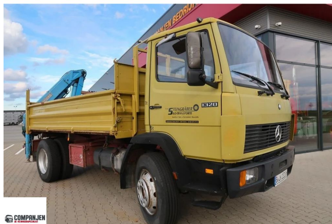
Mercedes-Benz SK 1320 SK1320 - 1988 - Side tipper - Meiller crane - ... 4x2