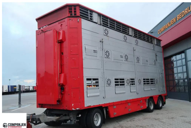
Pezzaioli RBA 31 - 2002 - 3 Floors - Livestock transport