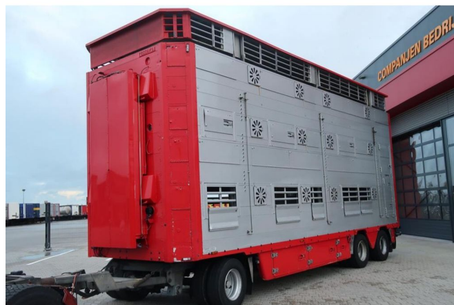
Pezzaioli RBA 31