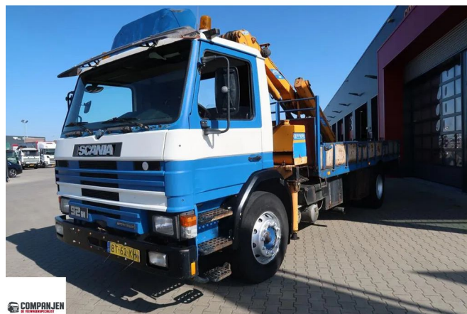
Scania 92M - Effer Kraan