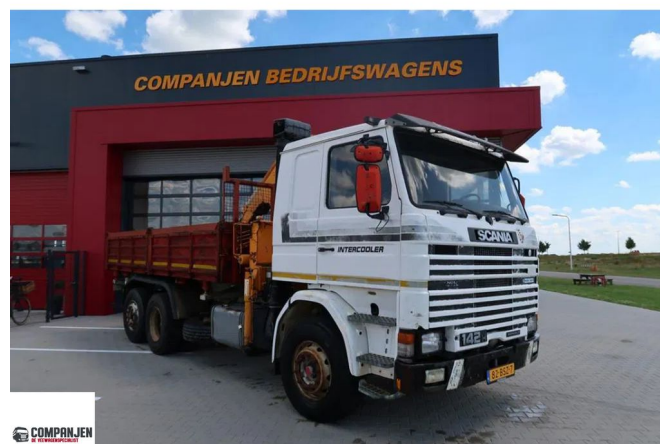
Scania R142-V8 R142 V8 - 1988 - Tipper with crane