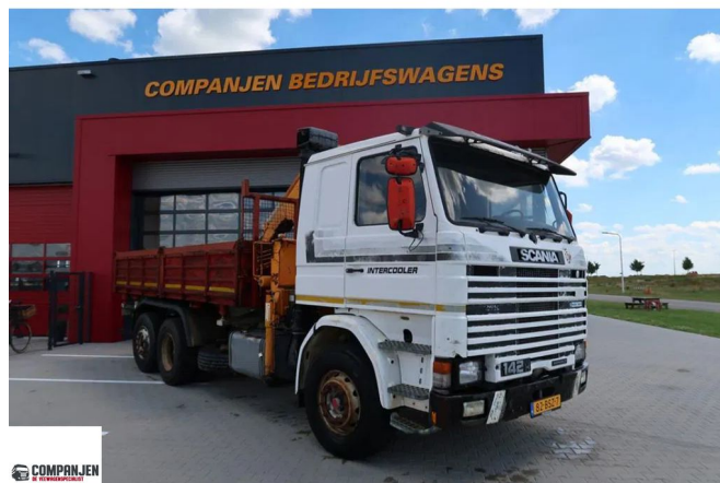
Scania R142-V8 R142 V8 - 1988 - Tipper with crane