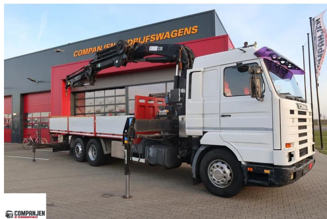
Scania R143-420 V8 Hiab 330-5 - JIB 90