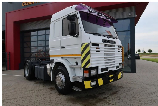
Scania R143-450 V8 143-450 Topline