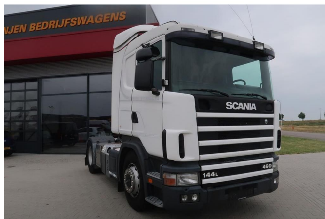
Scania R144-460 V8 144L - 460