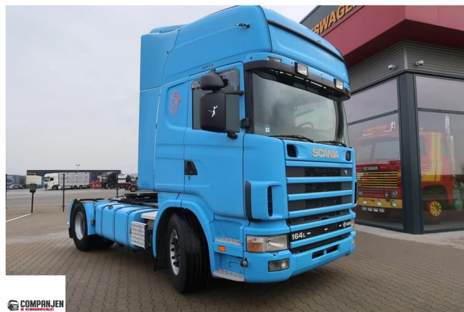
Scania R164-480 164-480 - 2004 - Retarder