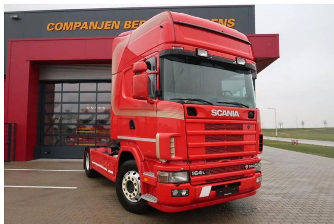
Scania R164-580 V8 R 164