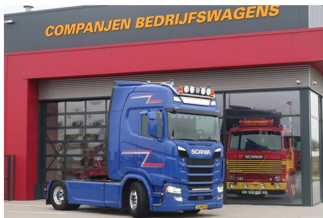
Scania S450 Special interieur full options!! Original Dutch truck Nice c... 4x2