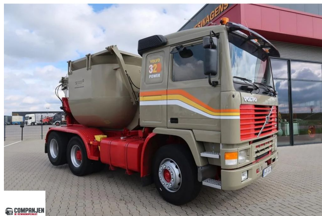
Volvo F 10.320 F10.320 - 1992 - TD122 - Oldtimer