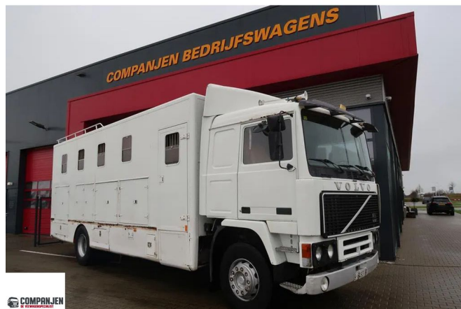
Volvo F 12 F12-20