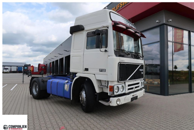
Volvo F 12.360 F12.360 Globetrotter