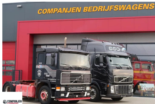
Volvo F 16.485 F16 - 485 - 1989 - Oldtimer