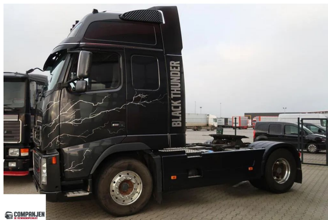
Volvo FH 16.660 FH 16.660 - 2007 - Euro 4 - Retarder