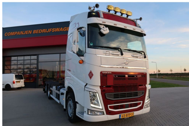
Volvo FH 500 VTJ3R